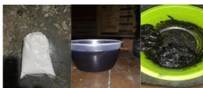
Gambar 5. Campuran Arang Briket Kanji dan molase

Tahap dalam pencampuran arang briket sebagai berikut: