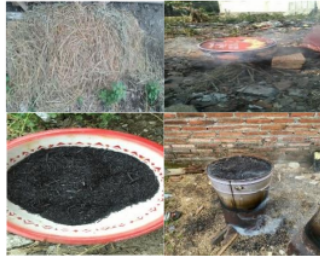
Gambar 2. Pembakaran sekam padi dan batang jerami padi

Tahap pertama dalam pembakaran bahan utama sebagai berikut: