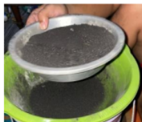
Gambar 4. Proses Penyaringan Arang