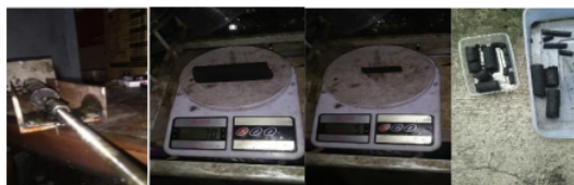
Gambar 6. Pengempaan atau Pembentukan

Tahap dalam pengempaan dan penjemuran sebagai berikut: