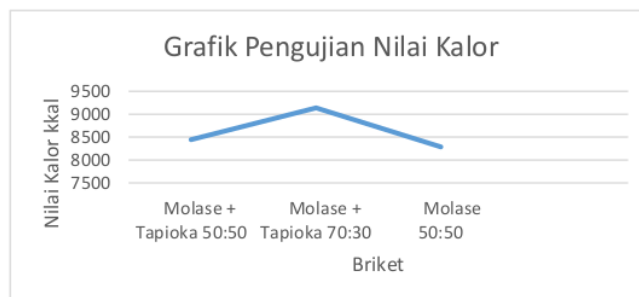
Gambar 9. Grafik Pengujian Nilai Kalor

Berikut dibawah ini adalah grafik pengujian nilai kalor 3 tertinggi dari 24 sampel yang kami uji