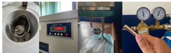
Gambar 8. Pengujian sampel Arang Briket