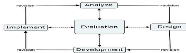
Gaambar 1. Tahap Pengembangan Model ADDIE

Peneliti menggunakan pendekatan Research and Development (R&D). Research and Development (R&D) biasanya digunakan untuk membuat produk, prosedur, atau teknologi baru [18]. Penelitian memakai model Addie kepanjangan dari Analysis, Design, Development, Implementation dan Evaluation [19].