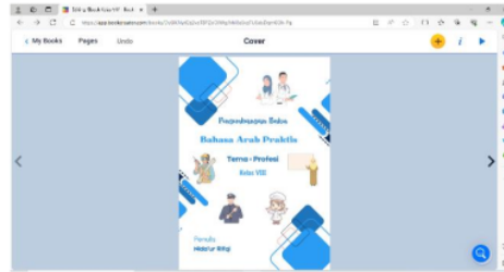
Gambar 3. Cover memakai template Canva

Design selesai, lanjut masuk pada materi yang diambil dari bab 1 profesi. peneliti merekam suara di Book Creator setelah mengambil gambar-gambar dari google.