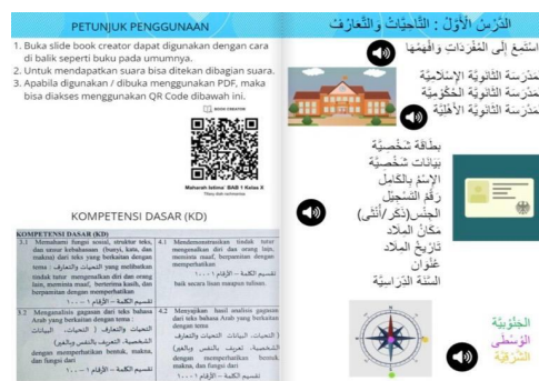
Gambar 3. Petunjuk penggunaan, kompetensi dasar dan kosakata bahasa Arab

Sampul book creator bahasa Arab kelas X Madrasah Aliyah didesain menarik menggunakan beragam fitur yang ada di book creator.