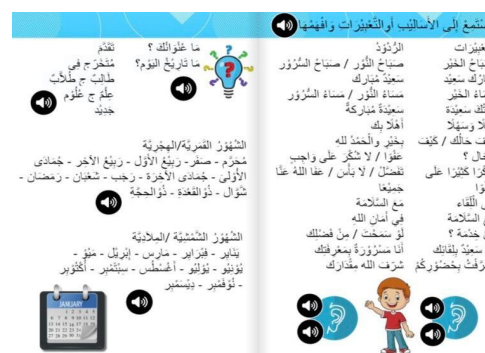
Gambar 4. Kosakata bahasa Arab dan ungkapan

Petunjuk penggunaan book creator dapat diakses menggunakan QR Code yang tercantum dalam book creator tersebut, kompetensi dasar yang sesuai buku bahasa Arab kelas X Madrasah Aliyah dari kemenag dan penyajian kosakata bahasa Arab beserta gambar dan suara tentang sekolah, identitas diri/biodata dan mata angin.