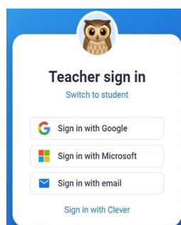
Gambar 1. Log in akun book creator

Pada tahap pengembangan peneliti melakukan pembuatan akun book creator.