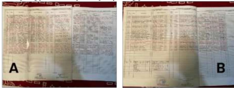
Gambar 4. Data siswa Aktif Kurikulum 2013 (A) dan Kurikulum Merdeka (B)

Pada gambar 3 diatas merupakan buku materi untuk kurikulum k13 kelas 5 ini sudah bagus tetapi masih ada yang kekurangan dalam hal penyampaian materi oleh guru sehingga siswa kurang aktif dalam pembelajaran yang mengakibatkan berpengaruh pada hasil belajar siswa tersebut. Berbeda dengan kurikulum merdeka untuk kelas 2 itu sangat bagus bentuk tatanan materi dan cara penyampaian oleh guru lebih ke belajar sambil bermain maka dari itu siswa jarang jenuh karena pembelajarannya mengajak siswa untuk aktif dalam kelas.