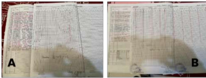
Gambar 1. Daftar Hadir Kurikulum 2013 (A) dan Kurikulum Merdeka (B)

Pada gambar 1 data hadir Kurikulum 2013 dan kurikulum merdeka tidak banyak perbedaan sebagai contoh di kelas 5 untuk Kurikulum 2013 dan sedangkan di kurikulum merdeka dari kelas 2. Data hadirnya pada umumnya tidak jauh berbeda yakni dengan dikelompokkan ke dalam tiga kategori, yaitu: (1) alpa, ketidakhadiran tanpa penjelasan, dimana siswa absen tanpa alasan yang jelas atau dapat dipertanggungjawabkan; (2) ijin, ketidakhadiran yang dapat dipertanggungjawabkan, ketika siswa absen dengan alasan yang sah dan dapat dibenarkan, seringkali dilengkapi dengan surat pemberitahuan dari orang tua; serta (3) sakit, ketidakhadiran karena sakit, ketika siswa absen karena alasan kesehatan, seringkali dilengkapi dengan surat keterangan dokter atau surat pemberitahuan dari orangtua. Pendekatan yang dilakukan guru terhadap kehadiran siswa mencakup memastikan siswa masuk ke dalam kelas dan memperhatikan setiap siswa secara individual. Selain itu, guru juga mengidentifikasi siswa yang hadir dan tidak hadir secara individual. Pada jam-jam berikutnya setelah istirahat, penting bagi guru untuk tetap di kelas, karena mungkin ada siswa yang pulang lebih awal dari yang dijadwalkan. Seringkali, siswa diberi izin untuk pulang setelah jam pertama. Daftar kehadiran, atau sering disebut sebagai absensi, bertujuan untuk mencatat kehadiran siswa di sekolah dan memantau kemajuan akademik mereka. Tanggung jawab guru adalah untuk memantau dan mencatat kehadiran siswa sepanjang hari.