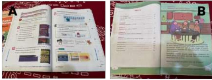
Gambar 3. Buku Materi yang disampaikan Kurikulum 2013 (A) dan Kurikulum Merdeka (B)

Pada gambar 3 diatas merupakan buku materi untuk kurikulum k13 kelas 5 ini sudah bagus tetapi masih ada yang kekurangan dalam hal penyampaian materi oleh guru sehingga siswa kurang aktif dalam pembelajaran yang mengakibatkan berpengaruh pada hasil belajar siswa tersebut. Berbeda dengan kurikulum merdeka untuk kelas 2 itu sangat bagus bentuk tatanan materi dan cara penyampaian oleh guru lebih ke belajar sambil bermain maka dari itu siswa jarang jenuh karena pembelajarannya mengajak siswa untuk aktif dalam kelas.