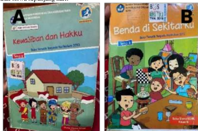
Gambar 2. Buku Pedoman Kurikulum 2013 (A) dan Kurikulum Merdeka (B)

Pada gambar 1 data hadir Kurikulum 2013 dan kurikulum merdeka tidak banyak perbedaan sebagai contoh di kelas 5 untuk Kurikulum 2013 dan sedangkan di kurikulum merdeka dari kelas 2. Data hadirnya pada umumnya tidak jauh berbeda yakni dengan dikelompokkan ke dalam tiga kategori, yaitu: (1) alpa, ketidakhadiran tanpa penjelasan, dimana siswa absen tanpa alasan yang jelas atau dapat dipertanggungjawabkan; (2) ijin, ketidakhadiran yang dapat dipertanggungjawabkan, ketika siswa absen dengan alasan yang sah dan dapat dibenarkan, seringkali dilengkapi dengan surat pemberitahuan dari orang tua; serta (3) sakit, ketidakhadiran karena sakit, ketika siswa absen karena alasan kesehatan, seringkali dilengkapi dengan surat keterangan dokter atau surat pemberitahuan dari orangtua. Pendekatan yang dilakukan guru terhadap kehadiran siswa mencakup memastikan siswa masuk ke dalam kelas dan memperhatikan setiap siswa secara individual. Selain itu, guru juga mengidentifikasi siswa yang hadir dan tidak hadir secara individual. Pada jam-jam berikutnya setelah istirahat, penting bagi guru untuk tetap di kelas, karena mungkin ada siswa yang pulang lebih awal dari yang dijadwalkan. Seringkali, siswa diberi izin untuk pulang setelah jam pertama. Daftar kehadiran, atau sering disebut sebagai absensi, bertujuan untuk mencatat kehadiran siswa di sekolah dan memantau kemajuan akademik mereka. Tanggung jawab guru adalah untuk memantau dan mencatat kehadiran siswa sepanjang hari.