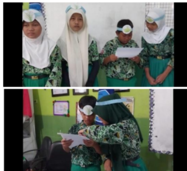
Gambar 2. Role Playing

playing , membuat lembar kuesioner untuk meningkatkan motivasi belajar siswa dalam pembelajaran IPAS dan soal tes sesuai dengan materi "Rantai Makanan". Tahap kedua pelaksanaan, pelaksanaan dilakukan selama tiga kali pertemuan pada tanggal 18,19,20 Januari 2024 peneliti melakukan penelitian dengan mengecek kesiapan belajar peserta didik, menyampaikan tujuan pembelajaran, kemudian peneliti menyampaikan materi pembelajaran yang akan dibahas. Tahap ketiga tindakan, tindakan kegiatan pada siklus I dilakukan dengan prosedur sebagai berikut: (1) Guru memaparkan materi tentang rantai makanan, (2) Peserta didik menyimak penjelasan dari guru, (3) Guru menyiapkan skenario yang akan ditampilkan, (4) Guru membagi peserta didik menjadi beberapa kelompok, masing-masing kelompok berjumlah 5-6 orang, (5) Guru menjelaskan kepada peserta didik bahwa mereka akan melakukan role playing atau bermain peran, (6) Guru menjelaskan peran masing-masing di setiap kelompok, (7) Peserta didik bermain peran untuk menunjukkan peran pada rantai makanan dari produsen, konsumen, dan pengurai, dapat dilihat pada Gambar 2, dan (8) Kemudian guru mengamati peserta didik dan memandu peserta didik apabila mengalami kesulitan dalam memerankan materi pelajaran tersebut.