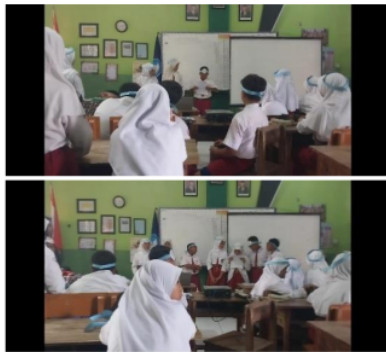
Gambar 1. Role Playing

playing, membuat lembar kuesioner untuk meningkatkan motivasi belajar siswa dalam pembelajaran IPAS dan soal tes sesuai dengan materi "Rantai Makanan". Tahap kedua pelaksanaan, pelaksanaan dilakukan selama tiga kali pertemuan pada tanggal 15,16,17 Januari 2024 peneliti melakukan penelitian dengan mengecek kesiapan belajar peserta didik, menyampaikan tujuan pembelajaran, kemudian peneliti menyampaikan materi pembelajaran yang akan dibahas. Tahap ketiga tindakan, tindakan kegiatan pada siklus I dilakukan dengan prosedur sebagai berikut: (1) Guru memaparkan materi tentang rantai makanan, (2) Peserta didik menyimak penjelasan dari guru, (3) Guru menyiapkan skenario yang akan ditampilkan, (4) Guru membagi peserta didik menjadi beberapa kelompok, masing-masing kelompok berjumlah 5-6 orang, (5) Guru menjelaskan kepada peserta didik bahwa mereka akan melakukan role playing atau bermain peran, (6) Guru menjelaskan peran masing-masing di setiap kelompok, (7) Peserta didik bermain peran untuk menunjukkan peran pada rantai makanan dari produsen, konsumen, dan pengurai, dapat dilihat pada Gambar 1, dan (8) Kemudian guru mengamati peserta didik dan memandu peserta didik apabila mengalami kesulitan dalam memerankan materi pelajaran tersebut.