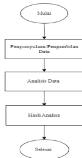
1 Gambar 1. Alur Analisis Data

Analisis data akan memfasilitasi identifikasi pola penggunaan energi listrik dan penyusunan rekomendasi untuk meningkatkan efisiensi penggunaan energi.