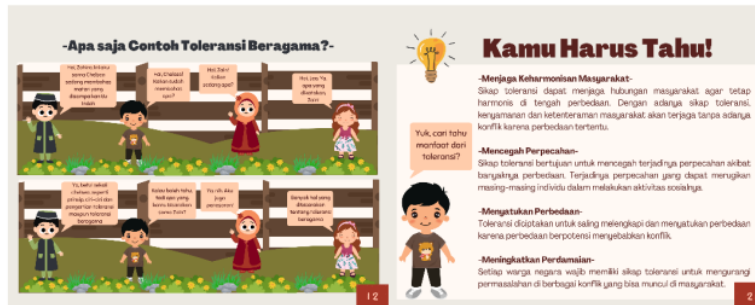
Gambar 5. Media Komik

Hasil penelitian ini pada uji independen menunjukkan bahwa model pembelajaran Multi-Matobe dibantu media komik menjadi fasilitas siswa dalam keterampilan berpikir kritis. Media komik berisikan masalah toleransi beragama dengan sila-sila Pancasila, terutama sila kesatu Pancasila. Siswa mampu menanamkan nilai toleransi dan nilai multikultural kepada siswa. Selain itu, penerapan model pembelajaran Multi-Matobe bertujuan mendorong siswa untuk berpikir kritis guna memecahkan masalah yang disajikan selama pembelajaran tematik muatan pembelajaran PKN [36], [37]. Media komik digunakan sebagai fasilitas untuk meningkatkan keterampilan berpikir kritis siswa dan isi pembelajaran yang disajikan dengan mengajak siswa menanamkan toleransi dan mengenal masalah toleransi beragama yang ditunjukkan pada Gambar 5.