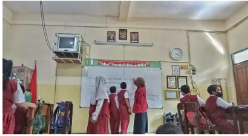
Gambar 3. Siswa diberikan pertanyaan pemantik yang berkaitan dengan materi pelajaran