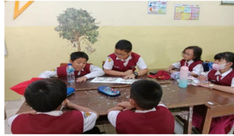
Gambar 4. Siswa mengenal toleransi beragama dengan dibantu media komik

Hasil penelitian ini pada uji independen menunjukkan bahwa model pembelajaran Multi-Matobe dibantu media komik menjadi fasilitas siswa dalam keterampilan berpikir kritis. Media komik berisikan masalah toleransi beragama dengan sila-sila Pancasila, terutama sila kesatu Pancasila. Siswa mampu menanamkan nilai toleransi dan nilai multikultural kepada siswa. Selain itu, penerapan model pembelajaran Multi-Matobe bertujuan mendorong siswa untuk berpikir kritis guna memecahkan masalah yang disajikan selama pembelajaran tematik muatan pembelajaran PKN [36], [37]. Media komik digunakan sebagai fasilitas untuk meningkatkan keterampilan berpikir kritis siswa dan isi pembelajaran yang disajikan dengan mengajak siswa menanamkan toleransi dan mengenal masalah toleransi beragama yang ditunjukkan pada Gambar 5.