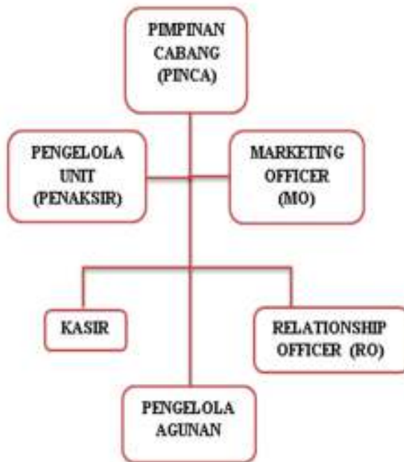
Bagan 1. Struktur Organisasi