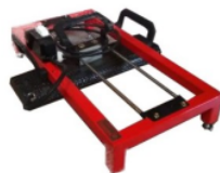
Curing untuk pengeringan tinta sablon yang menempel di kain.

Gambar desain dimulai dengan media cetak saring menggunakan screen sablon kayu ukuran 40x60. Screen ditempel di kain yang sudah ditempatkan di atas meja sablon, dengan cara digesut sampai tinta sablon turun dengan rata. Kain yang sudah disablon, tintanya dikeringkan dengan curing flash dengan suhu tertentu sampai tinta matang merata di atas kaos.