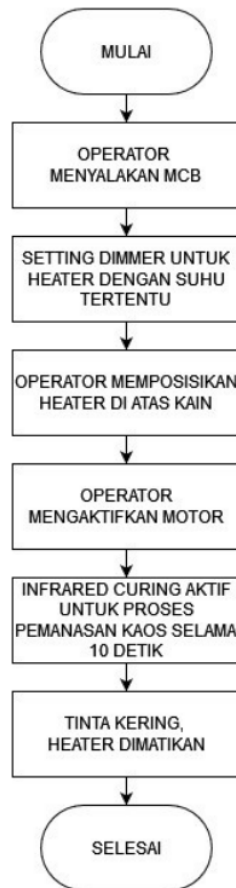
Gambar 3. Flowchart

Flowchart dimulai saat operator menyalakan MCB. Kemudian operator mengatur intensitas nyala dari infrared heater menggunakan dimmer. Curing ditempatkan di atas kain yang sudah ditemplei oleh tinta sablon plastisol. Kemudian heater 1 dan 2 ON dengan suhu 70°C. Operator lalu menyalakan motor menggunakan saklar untuk menjalankan proses maju-mundur. Infrared heater untuk proses curing aktif sehingga proses pemanasan tinta sablon kaos dapat berjalan secara otomatis selama 10 detik sampai tinta kering.