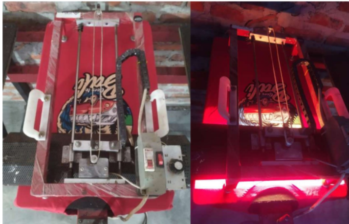
Gambar 5. Realisasi Alat

Gambar di atas menampilkan hasil realisasi alat berupa alat pengering tinta sablon atau curing yang memanfaatkan pemanas infrared. Pemanas akan bergerak maju mundur dengan bantuan synchronous motor agar panas yang dihasilkan ke hasil sablon kaos dapat merata.