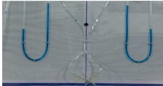
Gambar 4. Hasil Pengujian Manometer U