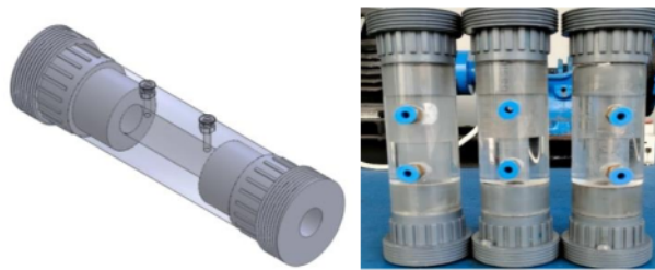
Gambar 1. Desain Eksperimen Penelitian

Pada Proses pembuatan sebuah alat diperlukan desain untuk konsep benda kerja dengan tujuan agar perancangan alat dapat membuat alat dengan mudah untuk menjalankan pekerjaan yang dilakukan oleh perancang. Dibawah ini merupakan rancangan desain tabung akrilik.