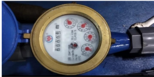
Gambar 5. Flowmeter