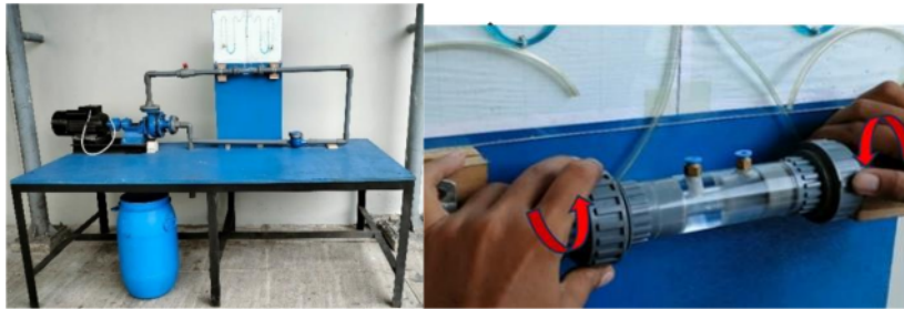
Gambar 3. Instalasi Penelitian

Pada percobaan tiga benda proses uji sudden enlargement . Metode ini sesuai dengan percobaan yang telah ditentukan. Langkah-langkah untuk proses uji sudden enlargement adalah sebagai berikut: