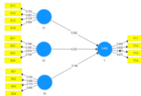
Gambar 1. Outer Loading

Dalam penelitian ini akan digunakan batas loading factor sebesar 0,5. Penilaiannya dapat dilihat dari gambar 1 dan tabel 1 sebagai berikut: