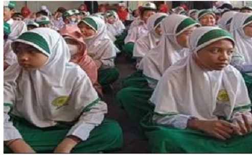
Gambar 2. Istighosah Bersama

Gambar di atas menunjukkan beberapa kegiatan yang terjadi di MI Ma'arif Pagerwojo selama peneliti melakukan kegiatan pengumpulan data guna sumber dari penelitian kali ini. Pada gambar pertama, terdapat proses kegiatan pembelajaran aqidah akhlak yang berlangsung di kelas 4D. Pembelajaran tersebut diikuti dengan tertib dan penuh semangat oleh para peserta didik. Lalu gambar kedua merupakan kegiatan istighosah yang dilakukan secara bersama dan rutin oleh seluruh warga sekolah.