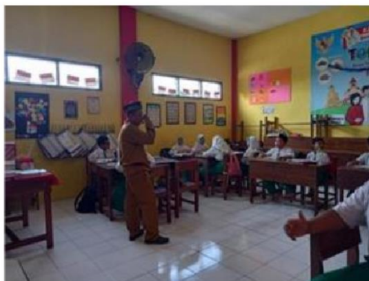
Gambar 1. Pembelajaran Aqidah Akhlak

Untuk memperkuat dari hasil penelitian yang sudah didapat, peneliti juga menyertakan beberapa bukti dokumentasi pendukung yaitu foto terkait proses pembelajaran serta beberapa kegiatan pendukung lainnya. Berikut beberapa perolehan data penguatnya :