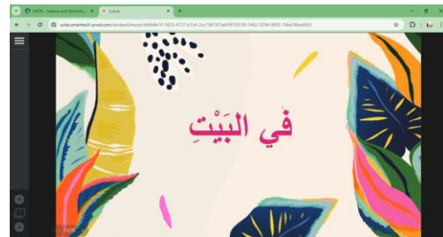
Gambar 2. Slide awal