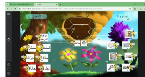
Gambar 4. Permainan