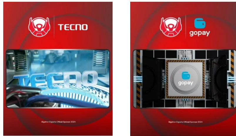
Gambar 5. Postingan feed dan reels instagram @bigetronesports