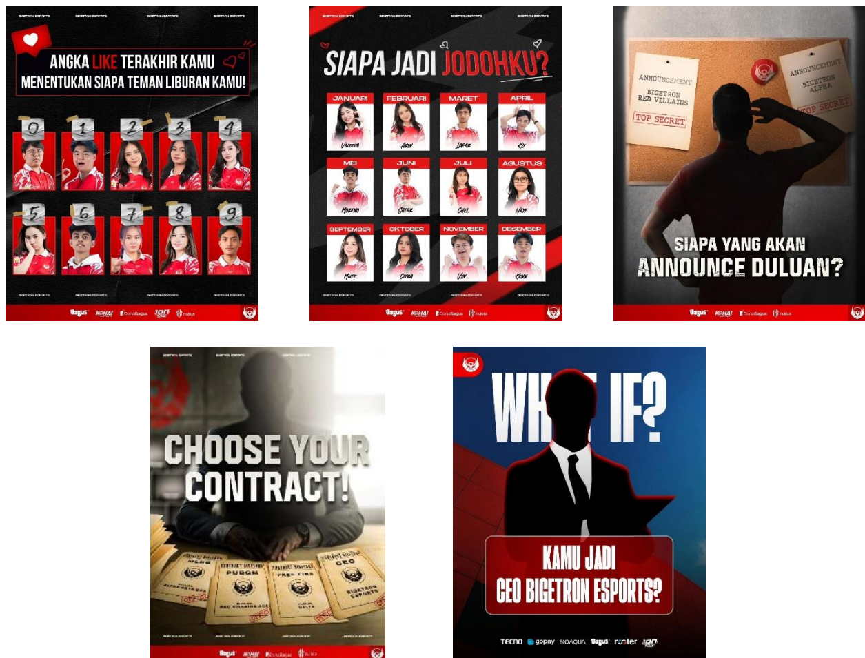
Gambar 2. Postingan feed Instagram @bigetronesports

Personal Meaning Strategies adalah strategi branding yang bertujuan untuk membentuk hubungan emosional antara merek dan konsumen dengan memanfaatkan makna personal atau emosional yang terkait dengan merek tersebut. Bigetron memanfaatkan strategi ini untuk strategi branding mereka melalui media sosial Instagram. Strategi ini dibagi menjadi 6 aspek diantaranya, Brand As A Person, Brand As A Friend, Brand And Romance, Nostalgia, Experience Brand, Brand As Underdog.