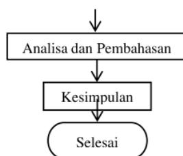
Gambar 1. Diagram Alir Penelitian