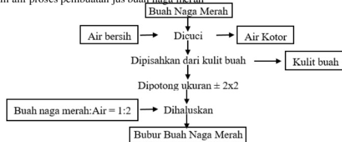
Gambar 1. Diagram alir proses pembuatan jus buah naga merah