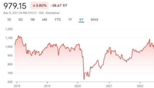
Gambar 1 : Pergerakan Harga Saham Perusahaan LQ45 Periode 2018-2022 (Sumber : www.idx.com )

Pada gambar 1 memperlihatkan pergerakan harga saham perusahaan LQ45 yang mengalami fluktuasi atau peningkatan dan penurunan selama periode 2018-2022. Dari pergerakan harga saham indeks LQ 45 tersebut terjadi peningkatan harga saham tertinggi pada tahun 2018 hingga mencapai level tertingginya di 1.132 perlembar. Sedangkan penurunan harga saham indeks LQ45 terendah pada tahun 2020 mencapai level terendah 9 di 622 perlembar, penurunan tersebut terjadi karena adanya dampak dari pandemi Covid-19. Namun tahun selanjutnya pergerakan saham LQ 45 mampu melonjak kembali meski selalu mengalami beberapa penurunan harga saham. Hal tersebut terjadi karena lemahnya likuiditas dari saham Indeks LQ 45, dan juga karena adanya beberapa 6 perusahaan mengalami kerugian yang diakibatkan arus kas yang tersumbat dan hutang perusahaan yang besar. Banyak faktor yang menyebabkan fluktuasi harga saham tersebut salah satunya adalah jumlah permintaan dan penawaran dari saham. Jika investor banyak menjual suatu saham, maka akan menyebabkan harga saham mengalami penurunan. Salah satu informasi yang penting untuk diperhatikan oleh investor dalam melakukan transaksi jual beli saham adalah harga saham itu sendiri. ( www.CNBCIndonesia diakses pada tanggal 09 november 2023).