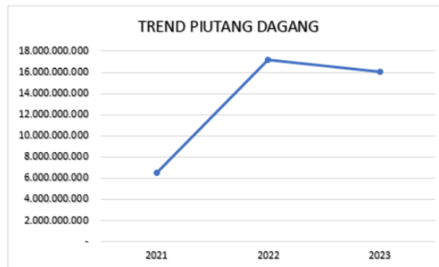
Gambar 4.2 Trend Piutang Dagang

Gambar 4.2 menunjukkan trend piutang dagang PT. Berkah Hidup Syukur tahun 2021-2023. Piutang dagang pada tahun 2021 yaitu sebesar Rp. 6.513.585.611. Untuk tahun 2022 jumlah piutang dagangnya mengalami kenaikan sebesar 17.136.331.436. Sedangkan di tahun 2023 nilai piutang dagangnya menurun sebesar Rp. 16.058.929.616. dapat dilihat kenaikan piutang di tahun 2022 ini dikarenakan penjualannya secara kredit yang menimbulkan piutang. Dan pada tahun 2023 nilai piutangnya masih tinggi ini dikarenakan piutang di tahun 2022 masih ada yang belum tertagih.