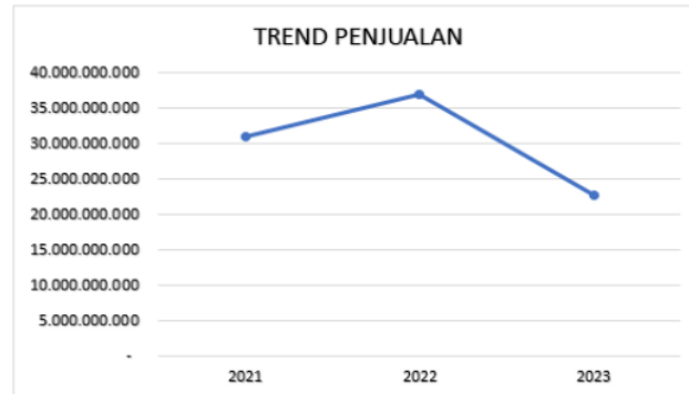
Gambar 4.1 Trend Penjualan

Gambar 4.1 menunjukkan trend penjualan kredit PT. Berkah Hidup Syukur tahun 2021-2023. Penjualan tahun 2021 yaitu sebesar Rp. 31.007.562.237. Lalu pada tahun 2022 penjualannya mengalami kenaikan yaitu sebesar Rp. 37.014.903.874. Sedangkan di tahun 2023 jumlah penjualannya mengalami penurunan sebesar Rp. 22.705.639.157. Dari hasil Trend penjualan selama 2021-2023 pada tahun 2022 mengalami kenaikan di karenakan mendapat beberapa proyek besar dan di tahun 2023 mengalami penurunan penjualan dikarenakan tidak ada proyek baru yang masuk untuk yang nilainya besar.