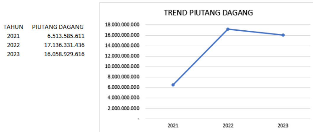
Gambar 4.2 Trend Piutang Dagang

Piutang dagang dari PT Berkah Hidup Syukur selama tahun 2021-2023 dapat dilihat pada gambar dibawah ini :