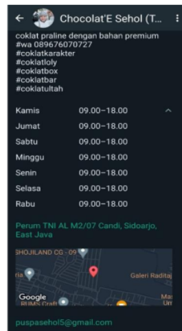
Gambar 4. Katalog WhatsApp Business.