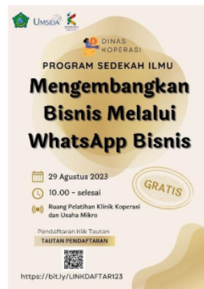
Gambar 1. Flyer Kegiatan Sedekah Ilmu.

Kegiatan diawali dengan penyebaran flyer kepada pelaku UMKM Sidoarjo melalui WhatsApp di sudah dibentuk sebagai wadah untuk sharing season kepada UMKM. Adapun flyer dan grub yang sudah dibuat sebagai berikut :