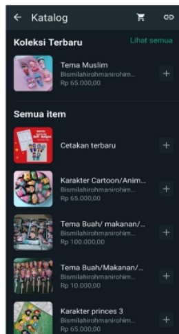
Gambar 3. WhatsApp Business.