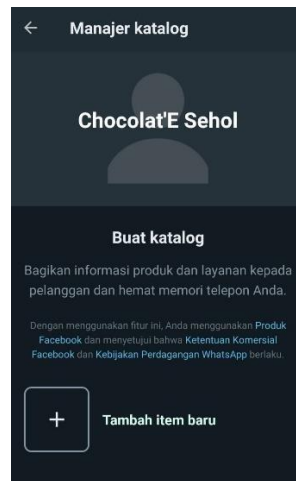
Gambar 6. Sebelum melakukan praktik fitur WhastApp Business. gambar di atas merupakan pasca sebelum mengetahui fitur-fitur pada WhatsApp Business.