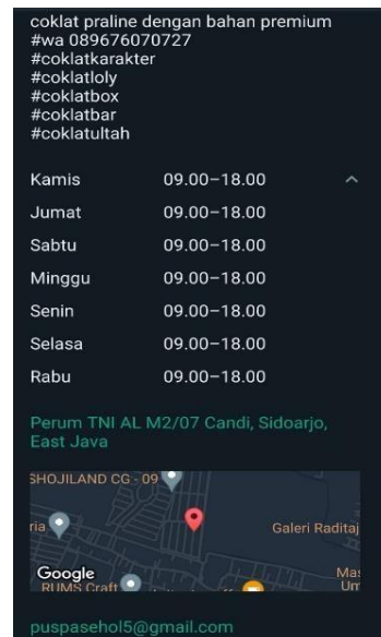
Gambar 7. Katalog WhatsApp Business. Gambar 8. Cover WhatsApp Business. Pada gambar di atas merupakan hasil pasca sesudah mengetahui fitur-fitur WhatsApp business dan masa pendampingan setelah mengikuti pelatihan WhatsApp Busines di Dinas Koprasi Sidoarjo.