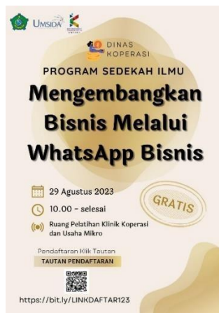
Gambar 1. Flyer Kegiatan Sedekah Ilmu.

Kegiatan diawali dengan penyebaran flyer kepada pelaku UMKM Sidoarjo melalui WhatsApp yang sudah dibentuk sebagai wadah untuk sharing season kepada UMKM. Adapun flyer dan grub yang sudah dibuat sebagai berikut :