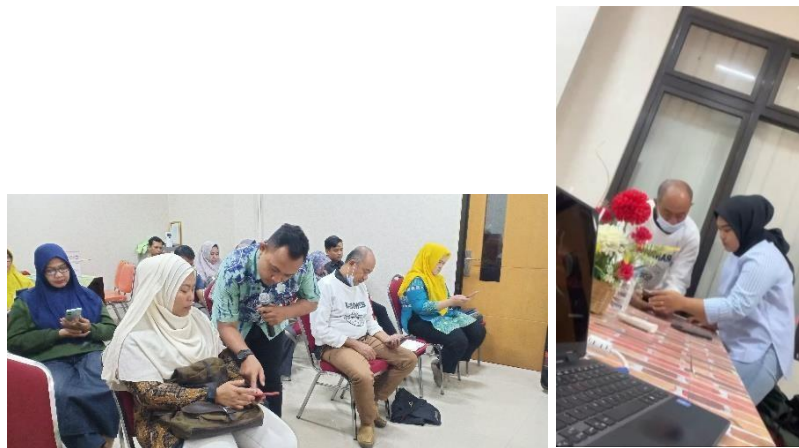
Gambar 5. Praktik Fitur-fitur pada WhatsApp Business.

Pada tahap kedua yakni pendampingan praktik UMKM untuk pembuatan katalog beserta fitur-fitur yang terdapat di dalam aplikasi WhatsApp Business tersebut. Yang dilakukan pada hari Kamis tanggal 21 September 2023 di tempat Ruang Klinin Usaha Mikro Sidoarjo.