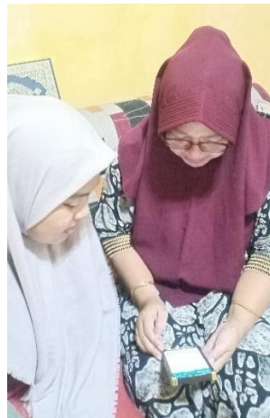
Gambar 6. Pendampingan pembuatan katalog di kediaman UMKM.

Pendampingan praktik UMKM untuk pembuatan katalog peserta fitur-fitur yang ada dalam aplikasi WhatsApp Business yang dilakukan pada jum'at tanggal 22 September 2023 di kediaman UMKM.