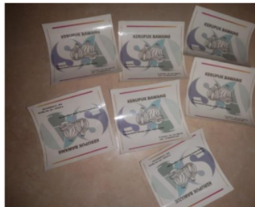
Gambar 4. Hasil Cetak Logo Kemasan

Pada tahap ini semua logo di cetak berdasarkan kebutuhan. Seperti pada gambar 3 berikut ini