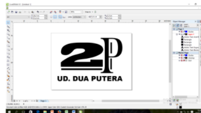
Gambar 2. Desain Logo Dengan Aplikasi Coreldraw

Diatas terdapat 2 (dua) contoh logo yang dibuat dalam kegiatan PKM. Pada gambar 1 logo dibuat dengan menggunakan aplikasi editing gambar yaitu Coreldraw yang di desain berdasarkan hasil obesrvasi serta difungsikan sebagai identitas dari Usaha dagang yang bernama "UD. SARI AGUNG" oleh karena itu penulis membuat desain dengan huruf S dan A sebagai singkatan dari Sari Agung yang merupakan nama dari Usaha Dagang kerupuk tersebut.