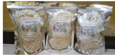
Gambar 6. Kerupuk Kemasan

Maka dipilihlah kemasan seperti yang dilihat pada gambar 4 yang dinamakan standing pouch atau biasa disebut plastik klip karena memiliki klip diatas kemasan yang mengunc rapat agar produk didalamnya tetap terjaga. Seperti produk kerupuk yng akan dikemas memiliki sifat yang mudah melemperm ketika kemasan tidak tertutup rapat. Dengan kemasan ini kemungkinan melemperm pada kerupuk menjadi lebih minim karena klip tertutup dengan sangat rapat.