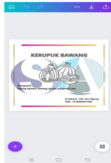
Gambar 3. Desain Logo Kemasan Menggunakan Aplikasi Canva

serta difungsikan sebagai identitas dari Usaha dagang yang bernama “UD. DUA PUTERA” dengan menonjokan desain angka 2 dan P sebagai singkatan dari Putera