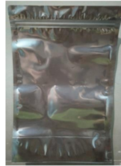
Gambar 5. Standing Pouch Transparan (SPT)

Pada tahap ini dilakukan dengan mengacu pada observasi produk kerupuk terkait kemasan apa yang cocok untuk digunakan. Tidak hanya digunakan sebagai daya tarik pembeli tapi juga harus bisa melindungi serta menjaga kualitas produk.