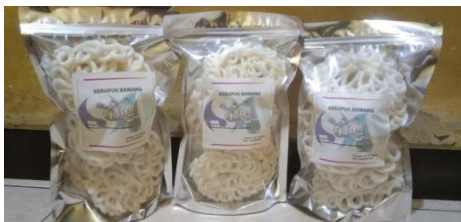
Gambar 6. Kerupuk Kemasan

Maka dipilihlah kemasan seperti yang dilihat pada gambar 5 yang dinamakan standing pouch atau biasa disebut plastik klip karena memiliki klip diatas kemasan yang mengunci rapat agar produk didalamnya tetap terjaga kualitasnya. Seperti produk kerupuk yang akan dikemas memiliki sifat yang mudah melemper ketika kemasan tidak tertutup rapat. Dengan kemasan ini kemungkinan melemper pada kerupuk menjadi lebih sedikit karena klip tertutup dengan sangat rapat.