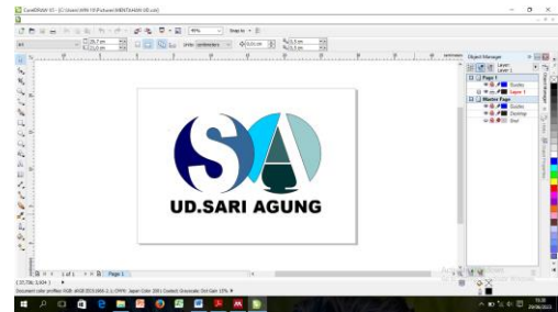
Gambar 1. Desain Logo Dengan Aplikasi Coreldraw

Pada gambar 1 logo dibuat dengan menggunakan aplikasi editing gambar yaitu Coreldraw yang didesain berdasarkan hasil observasi serta difungsikan sebagai identitas dari Usaha dagang yang bernama “UD. SARI AGUNG”.