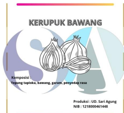
Gambar 3. Desain Logo Kemasan Menggunakan Aplikasi Canva

Di dalam gambar nomor 3 diperlihatkan gambaran desain logo yang digunakan untuk kemasan produk kerupuk dengan menonjolkan sisi utama logo produk serta penambahan informasi lain yang meliputi jenis kerupuk dimana dalam gambar ditulis “Kerupuk Bawang” dengan ditambah ornamen gambar bawang. Serta ditulis juga komposisi kerupuk dan informasi tentang produk lainnya yang meliputi Nomor induk Berusaha (NIB) dan kode produksi.