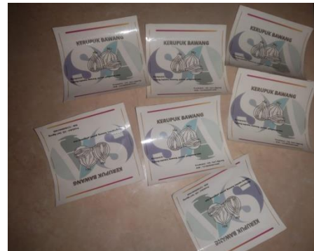
Gambar 4. Hasil Cetak Logo Kemasan

Pada tahap ini semua logo di cetak berdasarkan kebutuhan. Seperti pada gambar nomor 4 berikut ini