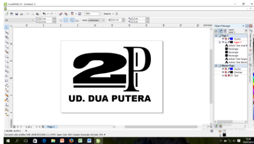
Gambar 2. Desain Logo Dengan Aplikasi Coreldraw

Gambar nomor 2 logo dibuat juga dengan menggunakan aplikasi editing gambar yaitu Coreldraw yang di desain berdasarkan hasil observasi serta difungsikan sebagai identitas dari Usaha dagang yang bernama “UD. DUA PUTERA” dengan menonjolkan desain angka 2 dan P sebagai singkatan dari Putera. Logo dibuat dengan memiliki makna serta arti didalamnya meliputi :