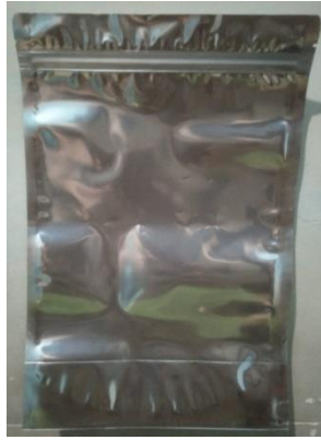
Gambar 5. Standing Pouch Transparan (SPT)

Maka dipilihlah kemasan seperti yang dilihat pada gambar 5 yang dinamakan standing pouch atau biasa disebut plastik klip karena memiliki klip diatas kemasan yang mengunci rapat agar produk didalamnya tetap terjaga kualitasnya. Seperti produk kerupuk yang akan dikemas memiliki sifat yang mudah melemper ketika kemasan tidak tertutup rapat. Dengan kemasan ini kemungkinan melemper pada kerupuk menjadi lebih sedikit karena klip tertutup dengan sangat rapat.