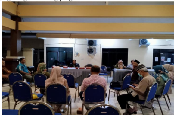
Gambar 3. Rapat BUMDes Tanjung Mekar