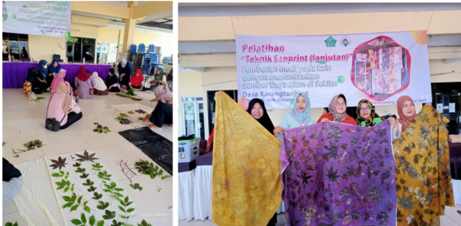
Gambar 1. Pelatihan Teknik Ecoprint

Berikut perbandingan antara penelitian terdahulu terkait BUMD dengan penelitian ini sebagai berikut : 1. Pengorganisasian di BUMD di Desa Watulaney hanya terdapat tiga orang pengurus BUMD di Desa Watulaney sehingga hal ini mempengaruhi keefektifan kinerja pengurus dalam menjalankan perannya. (J.Koso, dkk(2018); 2. Pengorganisasian BUMD di Desa Rasau Jaya pemilihan anggota yang akan dimasukkan dalam struktur organisasi BUMD masih sulit ditentukan oleh pemerintah desa setempat dikarenakan lemahnya inisiatif pemerintah desa dalam bekerjasama dengan masyarakat. (Hardilina. P, dkk (2022)). Sedangkan berdasarkan hasil penelitian di BUMD Tanjung Mekar di Desa Karangtanjung yaitu ada beberapa kendala yang hampir sama dengan penelitian terdahulu seperti kurangnya keefektifan kinerja pengurus. BUMDes Tanjung Mekar sudah mempunyai struktur organisasi yang lengkap meskipun ada beberapa anggota yang belum bisa melakukan pekerjaannya sesuai dengan standar operasional BUMD Tanjung Mekar. Namun disisi lain pemerintah desa turut serta mendukung dengan beberapa kali melakukan Studi tiru dan pelatihan-pelatihan lainnya.