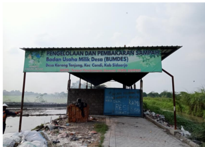
Gambar 2. Unit Pengelolaan Sampah

Berdasarkan hasil wawancara dengan Bendahara BUMD Tanjung Mekar di Desa Karangtanjung menurut beliau Badan Usaha Milik Desa juga mempunyai program pengolahan sampah yang dikelola langsung oleh BUMDes Tanjung Mekar. Meski tergolong baru tapi pengelolaan sampah ini menghasilkan cukup banyak pemasukan. Hanya saja untuk saat ini rincian pengelolannya belum dibuat terperinci. Namun hasil bersihnya selalu masuk di dalam pembukuan BUMDes. (Wawancara 20 Mei 2023)