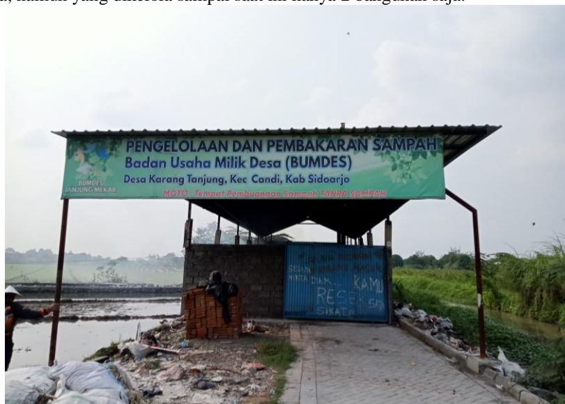
Gambar 2. Unit Pengelolaan Sampah

Kecamatan Candi wajib untuk mendaftarkan atau bekerjasama dengan Bank JATIM. Dalam pembukuan yang dimiliki oleh BUMDes di unit jasa dan pembayaran online ini sudah dibukukan dengan baik sehingga dalam setiap bulannya ada pelaporan dana yang masuk. Unit Perdagangan serta Unit Pasar Dan Pujasera menyediakan tempat untuk disewakan kepada masyarakat yang ingin memiliki tempat untuk menawarkan dagangannya. Bangunan yang dimiliki BUMDes menyediakan fasilitas bagi Masyarakat seperti kamar mandi umum dan aliran listrik. Terdapat 12 Bangunan pujasera yang tersedia, namun yang dikelola sampai saat ini hanya 2 bangunan saja.