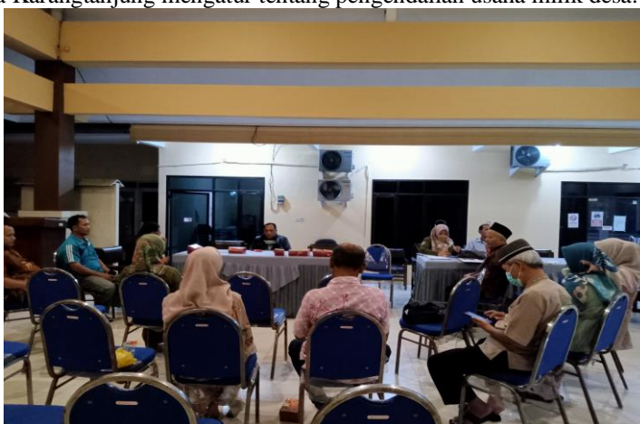
Gambar 3. Rapat BUMDES Tanjung Mekar

Dalam gambar diatas adalah gambar pertemuan Badan Usaha Milik Desa Tanjung Mekar dilaksanakan setiap dua bulan sekali di Desa Karangtanjung untuk meninjau perkembangan usaha Badan Usaha Milik Desa Tanjung Mekar. Pertemuan ini mempertemukan jajaran direksi perusahaan milik Desa Tanjung Mekar serta perangkat Desa Karangtanjung.