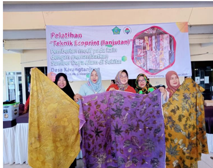
Gambar 1. Pelatihan Teknik Ecoprint

Pelatihan-pelatihan seperti gambar di atas yaitu Pelatihan Teknik Ecoprint dilaksanakan oleh Pemerintah Desa dengan bekerjasama dengan BUMDes dalam kurun waktu satu tahun sekali guna untuk mengembangkan potensi warga masyarakat untuk membuka usaha tersebut dengan mudah dan dapat membantu perkembangan BUMDes Tanjung Mekar.