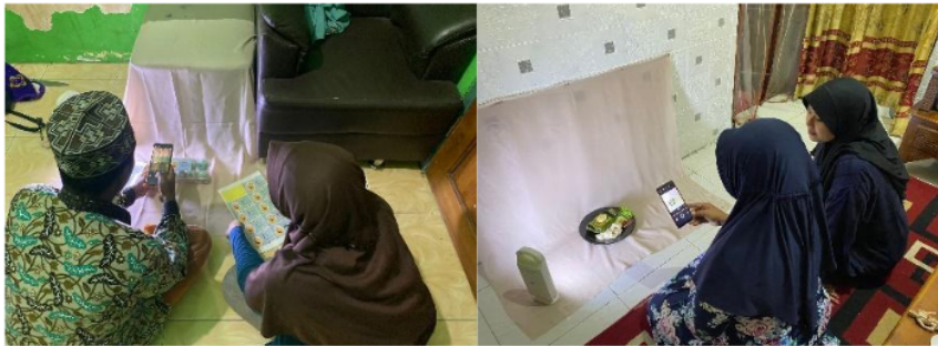
Gambar 3. Pelatihan Foto Produk Telur Asin Pak Poh & Nasi Obong Mama Bagas