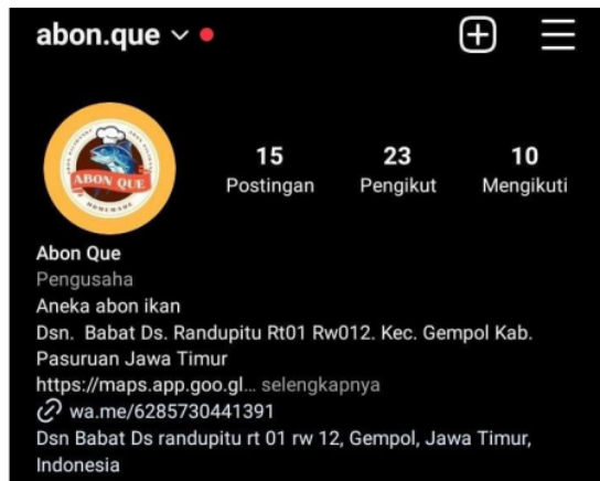
Gambar 8. Pengikut akun Abon Que.

Pada Gambar 8, followers pada akun Abon Que mengalami pertumbuhan yang sangat pesat, yaitu sebanyak 23 followers. Terbukti pada gambar 4, masih terdapat 4 followers pada akun Abon Que, begitu juga dengan postingan yang telah diunggah, banyak yang awalnya hanya 3 postingan. Sekarang sudah ada 15 postingan. Pada keterangan informasi, kami juga sudah mulai memberikan akses kepada pembeli atau pelanggan untuk dapat menghubungi pemilik Abon Que, dan kami juga sudah menambahkan link Google Maps untuk dapat mengetahui alamat dari Abon Que buatan sendiri.