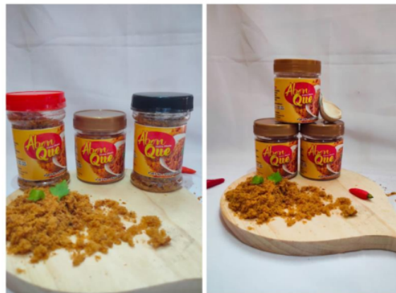
Gambar 5. Tangkapan layar dari akun Instagram

Pada tanggal 26 Juni 2023, kami membuat akun Instagram untuk UMKM Abon Ikan. Karena sebelumnya, pemilik UMKM abon ikan belum memiliki akun bisnis di media sosial Instagram. Setelah pembuatan akun selesai, tim pengabdian masyarakat memperkenalkan fitur-fitur yang ada pada akun bisnis tersebut kepada pemilik UMKM abon ikan. Seperti fitur insight, yang memberikan informasi mengenai follower dan konten yang populer (Damayanti et al., 2023). Kemudian ada fitur Instagram shopping, yang memudahkan pelanggan untuk membeli produk langsung dari Instagram. Terdapat fitur ad tools, dan Instagram menyediakan beberapa bentuk iklan yang dapat digunakan oleh para pelaku bisnis dalam membuat dan mengelola iklan di platform tersebut (Rohmansyah & As'ad, 2022). Kemudian ada fitur Instagram Stories, yang digunakan untuk memasarkan atau mempromosikan produk dengan cara membagikan foto dan video yang akan hilang setelah 24 jam. Dan dengan adanya fitur live broadcast, pelaku usaha dapat menyiarkan video secara langsung kepada para pengikutnya, sehingga ada yang namanya hubungan timbal balik dengan konsumennya (Soekendar & Pratiwi, 2023).