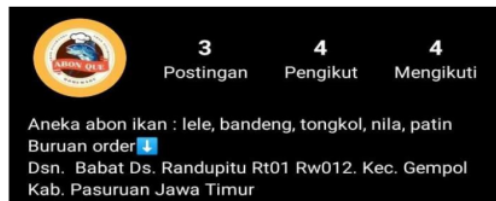
Gambar 6. Gambar produk

Logo pada akun Instagram tersebut memperlihatkan seekor ikan yang memakai topi koki, yang berarti abon ikan tersebut adalah buatan sendiri atau sering disebut home-made. Menurut (Jerman et al., 2015), warna latar belakang pada logo tersebut adalah warna oranye karena warna oranye merepresentasikan antusiasme, kegembiraan, kebahagiaan, dan kepuasan. Warna oranye juga sering digunakan sebagai alternatif untuk memberikan energi pada makanan dan membawa kesegaran bagi yang mengkonsumsinya (Khairina et al., 2019). Selanjutnya, bantu isi katalog di akun Instagram Anda untuk memudahkan calon pembeli memesan produk abon ikan. Setelah membuat akun, mengenalkan fitur-fitur yang ada di dalamnya dan membantu mengisi katalog di akun Instagram, selanjutnya melakukan pelatihan foto produk abon ikan (Kurniawan et al., 2022).