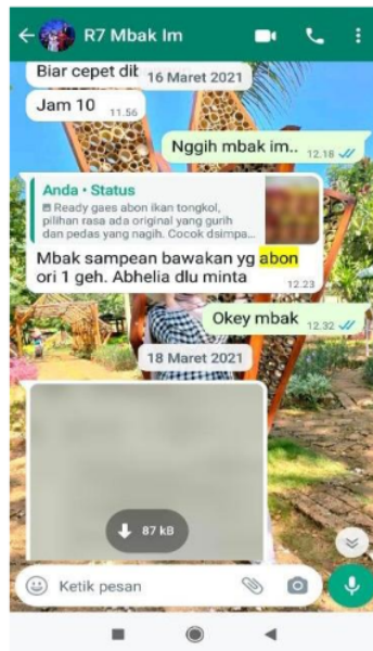
Gambar 3. Pelanggan memesan melalui cerita WhatsApp biasa

Unggahan produk abon ikan di WhatsApp story telah menarik minat pelanggan untuk membeli produk abon ikan tersebut. Hanya saja yang melihat unggahan tersebut adalah orang-orang terdekat mereka.