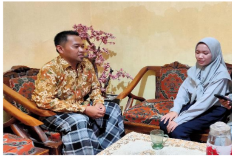
Gambar 2. Dokumentasi wawancara

Pada tanggal 20 Juni 2023, tim pengabdian masyarakat melakukan kunjungan ke tempat produksi UMKM abon ikan untuk mengumpulkan data yang ada. Dari hasil observasi dan wawancara yang telah dilakukan, tim pengabdian masyarakat memperoleh informasi bahwa promosi yang dilakukan oleh pemilik UMKM abon ikan hanya melalui whatsapp story biasa dan dari mulut ke mulut. Sehingga pelanggan yang memesan abon ikan hanya orang-orang terdekat saja.