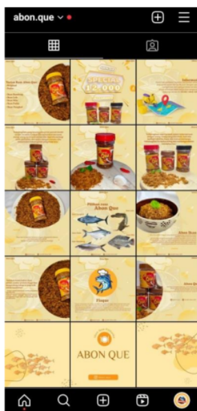
Gambar 7. 15 postingan akun Abon Que

Selama proses pendampingan yang dilakukan selama beberapa hari dalam seminggu, pemilik UMKM abon ikan memahami fitur-fitur utama Instagram. Sehingga pemilik UMKM abon ikan mengalami peningkatan pemahaman dalam menggunakan aplikasi Instagram dari hari ke hari (Machfiroh et al., 2023). Selama proses pendampingan, pemilik UMKM abon ikan dapat mengambil gambar dengan baik dan benar.