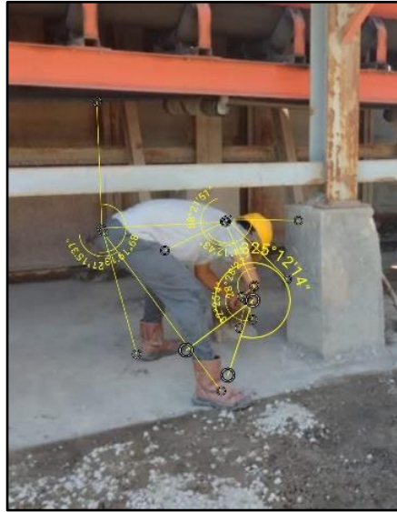
Gambar 1. Postur kerja aktivitas pekerja pada bagian variasi beton ready mix