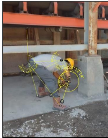
Gambar 1. Postur kerja aktivitas pekerja pada bagian variasi beton ready mix