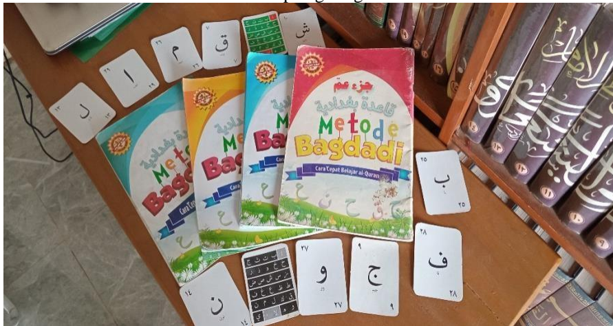
Gambar 3.2 pembelajaran Metode Bagdadi