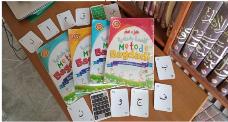
Gambar 3.2 pembelajaran Metode Bagdadi