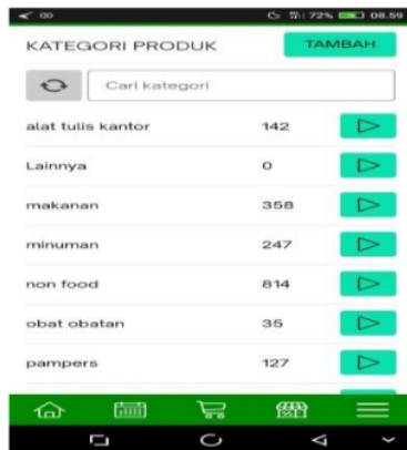
Gambar 8 kategori produk