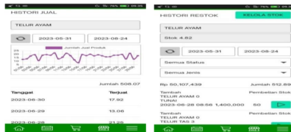
Gambar 10 laporan histori jual Gambar 11 laporan histori beli

“Saya setuju dengan jawaban Bu Ima, perlu laporan yang menyeluruh untuk mempermudah pengecekan barang masuk dan barang keluar” (Informan 2)