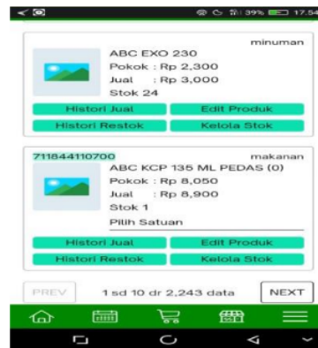
Gambar 7 tampilan produk

“Menggunakan metode perpetual, sehingga stok barang akan terus terupdate” (Informan 2)