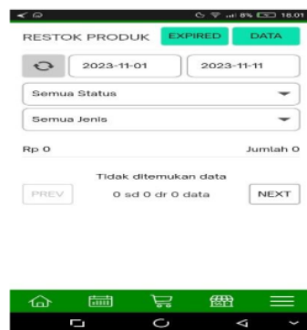
Gambar 9 Laporan order barang

"Iya, belum ada minimum stok pada aplikasi" (Informan 2)