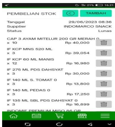
Gambar 3 Pencatatan Barang Masuk