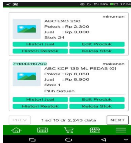
Gambar 7 tampilan produk

“Menggunakan metode perpetual, sehingga stok barang akan terus terupdate” (Informan 2)