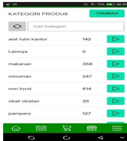
Gambar 8 kategori produk