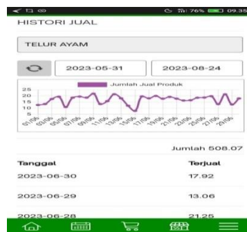
Gambar 10 laporan histori jual

“Saya setuju dengan jawaban Bu Ima, perlu laporan yang menyeluruh untuk mempermudah pengecekan barang masuk dan barang keluar” (Informan 2)