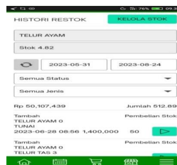
Gambar 11 laporan histori beli

Dari pengumpulan data buku stok diatas peneliti menyimpulkan bahwa laporan histori pembelian dan penjualan terpisah.