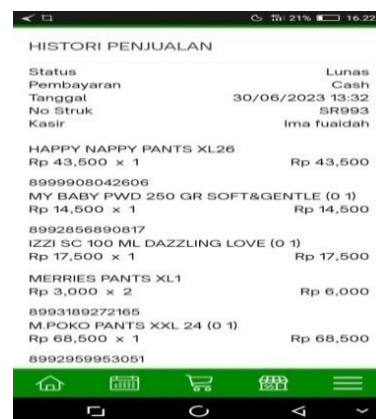
Gambar 4 Pencatatan Barang Keluar

Dari ketiga pengumpulan data bisa disimpulkan bahwa pencatatan persediaan barang pada Toko Berkah Abadi menggunakan aplikasi kasir berbasis Android Aplikasir telah memadai. Dilihat dari prosedur pengecekan barang sampai dengan input barang pada aplikasi sudah menunjukkan bahwa pengendalian persediaan telah berjalan dengan baik.