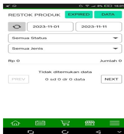
Gambar 9 Laporan order barang

“Iya, belum ada minimum stok pada aplikasi” (Informan 2)