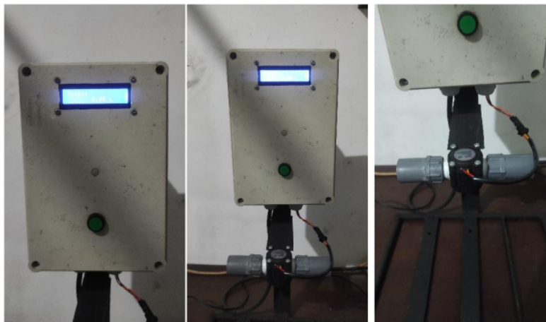
Gambar 4. Perangkat Pencatatan Debit Air Outlet Limbah IPAL