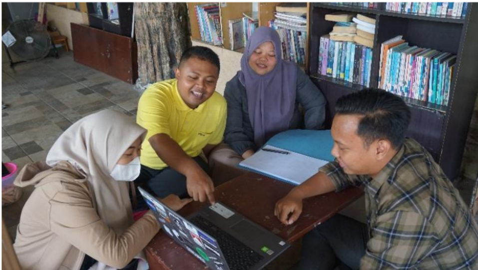
Gambar 1. Kegiatan Sosialisasi oleh Pemateri

Pada kegiatan ini mitra Pengabdian Kepada Masyarakat mengikuti kegiatan dengan baik, hal tersebut dapat dilihat dari berjalannya proses pemaparan materi yang interaktif, mitra abdimas juga menyimak penjelasan dengan baik. Selain itu mitra Pengabdian Kepada Masyarakat juga saling berdiskusi dengan pemateri. Sehingga kegiatan sosialisasi dapat diindikasikan bahwa mitra Pengabdian Kepada Masyarakat antusias dalam mengikuti kegiatan pengabdian kepada masyarakat.