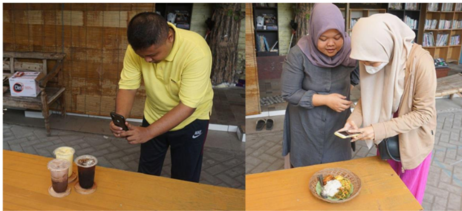
Gambar 2. Mitra Abdimas praktek memotret produknya

Sedangkan Sarapan Makbozz dapat meningkatkan jumlah penjualan rata-rata sebanyak 100-150 porsi perhari dengan sistem pre-order melalui WhatsApp Bussines, sebelumnya jumlah penjualan rata-rata sebanyak 50-80 porsi. WhatsApp Bussines memudahkan para pembeli untuk mengetahui menu yang tersedia dan mempermudah proses transaksi.