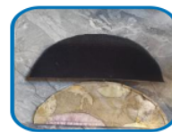
Figure 3. Making the gowang head cover