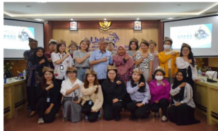
Gambar 7. Sesi foto bersama dengan memakai udeng pacul gowang hasil karya masing-masing