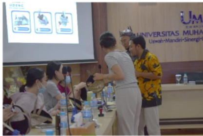
10 Gambar 1.

Penelitian ini telah dilakukan dengan serangkaian kegiatan yang membuahkan output sesuai target yang ada dan cukup baik dibuktikan dengan gambar sebagai berikut: