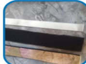
Figure 6. Head circumference making