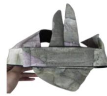
Gambar 5. Tampak belakang

Artefak budaya khas Jawa Timur adalah udeng. Udeng tersebar di beberapa wilayah di Jawa Timur yang memiliki perbedaan karakteristik sesuai dengan budaya daerah masing-masing. Daerah Sidoarjo sendiri, disebut dengan "Udeng Pacul Gowang" yang mayoritas digunakan oleh pengantin laki-laki "Putri Jenggolo". Berdasarkan bentuknya yang sangat kontras dengan daerah lainnya, nama tersebut diberikan. Perbedaan paling mencolok terletak pada bagian penutup kepala atasnya yang setengah tertutup dan separuh terbuka pada potongan penutup atas yang diletakkan dibagian belakang yang disebut penutup tengkuk, hal ini berbeda dibandingkan pada umumnya tertutup penuh ataupun terbuka sepenuhnya. Ditambah dengan motif batik khas Sidoarjo yang menghiasi tiap bagian Udeng mulai dari Bucen Runcing, Bucen Tumpul, Penutup Kepala Gowang, 2 Cungkup Tegak, Simpul Udeng, dan Penutup Tengkuk (Ní'mah, 2020). Dalam kegiatan workshop kali ini, pembuatan udeng Pacul Gowang dengan motif batik khas Sidoarjo, dibuat dengan berbahan dasar kain batik eco print . Adapun, tahapan proses pembuatan eco print meliputi 1)