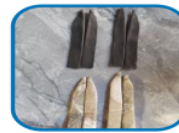
Figure 4. Making two enough