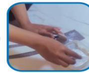
Figure 9. Documentation of udeng production (gluing)