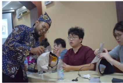
Gambar 6. Proses pembuatan udeng pacul gowang

6 branding sebagai sarana promosi budaya lokal Indonesia dalam konteks diplomasi budaya. Melalui konsep 4P ( product, price, place dan promotion ) sebagai dasar dari pemasaran. (Deniar & Pratika, 2022). Inovasi Udeng Pacul Gowang berbahan dasar batik eco print dapat dipasarkan diperjualkan ke masyarakat sekitar dan memperoleh banyak keuntungan. Kegiatan workshop ini diakhiri dengan sesi foto bersama dengan hasil udeng Pacul Gowang kreativitas masing-masing mahasiswa Universitas Malaya.