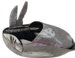
Gambar 4. Tampak atas