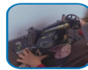
Figure 10. Documentation of udeng production (sewing)