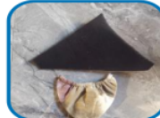
Figure 5. Making the nape cover