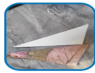
Figure 2. Making a pointed buncen