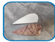
Figure 1. Blunt buncen making