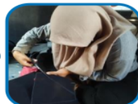
Figure 8. Documentation of udeng production (cutting)