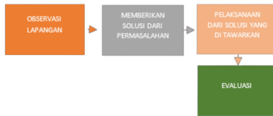
1 Gambar 1. Metode Pelaksanaan Kegiatan Pengabdian Kepada Masyarakat