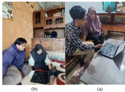
Gambar 6. Pelatihan pengunggahan Foto atau Video ke Instagram (a) Sego Tonggo (b) Tsabitha Foods

Setelah melakukan pembuatan akun sosial media Instagram dan pembuatan logo, selanjutnya kami melakukan pelatihan dalam mengunggah foto dan video ke media sosial Instagram. Kami memberikan pengarahan bagaimana mengatur feed yang baik dan efektif dengan memberikan opsi pemilik waktu dalam pengunggahan, kami menyarankan untuk mengunggah postingan Instagram pada 13.00 WIB dan pada pukul 20.00 WIB. Dimana pada kedua waktu tersebut merupakan waktu yang ideal, karena pada waktu tersebut merupakan waktu dimana masyarakat umum bermain sosial media mereka. Sehingga banyak orang yang meluangkan waktunya ketika istirahat sehingga memungkinkan postingan tersebut dilihat banyak pengguna Instagram.