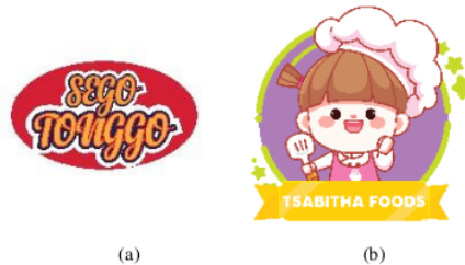
Gambar 3. Logo UMKM (a) Sego Tonggo dan (b) Tsabita Foods

dengan bentuk logo universal yang mudah ditangkap oleh masyarakat tentang bagaimana dan apa kelebihan dari produk tersebut. Hasil logo setelah rebranding: