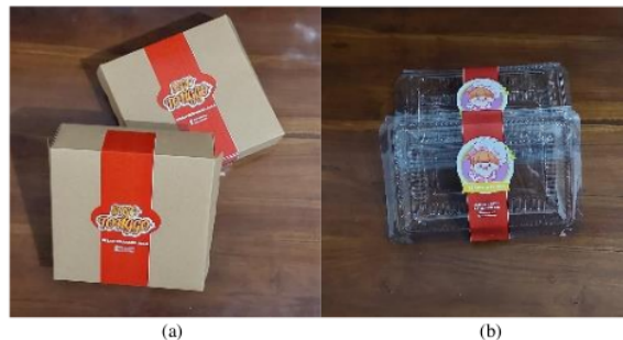
Gambar 4. Kemasan (a) Sego Tonggo dan (b) Tsabita Foods

Kegiatan pelaksanaan pengabdian masyarakat selanjutnya adalah kami membantu kedua UMKM untuk membuat kemasan baru yang cocok dengan produk mereka, Dimana kemasan juga merupakan salah satu faktor yang menentukan konsumen dalam membeli suatu produk tertentu. Dengan pemilihan kemasan yang bagus dan menarik maka akan meningkatkan juga daya jual pada suatu produk. Karena dirasa jika merubah bentuk kemasan secara tiba-tiba bisa membuat harga makanan menjadi naik secara signifikan untuk itu kami memberikan saran untuk memberi stiker pada setiap kemasan yang mereka pakai agar terlihat lebih rapi dan indah. Contoh kemasan setelah di rebranding.