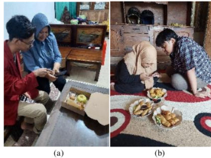
Gambar 5. Pelatihan mengambil foto produk (a) Sego Tonggo (b) Tsabitha Foods

memberikan pelatihan agar hasil foto yang mereka gunakan terlihat bagus saat di posting di feed instagram maupun di story instagram.