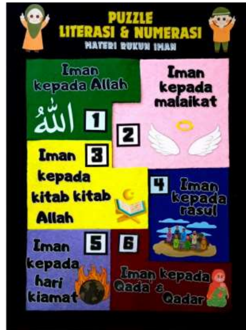
Figure 4. bentuk utuh puzzle literasi dan numerasi