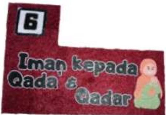
Figure 1. sisi depan keping puzzle