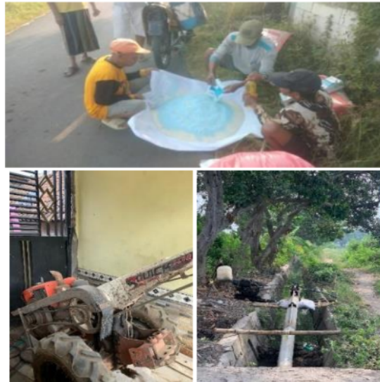
Gambar 2. Bantuan Dinas Pertanian, Perkebunan Dan Peternakan Sidoarjo