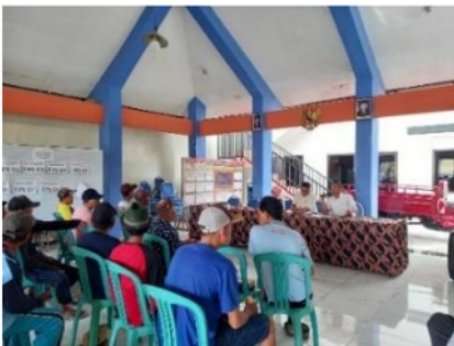
Gambar 1. Penetapan penanaman bibit bersama para anggota Gapoktan.

Dalam upaya pembangunan aktivitas pertanian masyarakat, efektifitasnya dapat ditingkatkan melalui peran pemerintah sebagai penggerak. Hal ini dikarenakan lingkungan dapat terpengaruh oleh sensitifitas dari kelompok tani, sehingga bimbingan dan motivasi menjadi peran pemerintah yang sangat dibutuhkan agar dapat memberikan pengaruh kepada kelompok tani dalam upaya perbaikan lingkungan serta mutu hidupnya. Selain itu, juga dibutuhkan arahan dari pemerintah untuk tetap mempertahankan keseimbangan dalam menyelenggarakan pembangunan. Sebagai dinamisator, peran dari pemerintah adalah terkait dengan pemberian arahan dan bimbingan yang menyeluruh dan efektif dengan sasaran seluruh masyarakat tanpa memandang strata sosial ataupun perbedaan yang terdapat di masyarakat. Hal ini sangat dibutuhkan dikarenakan selaras dengan kebutuhan dari masyarakat, sehingga dengan upaya yang dilakukan tersebut harapannya dinamika pemerintah di masyarakat dapat terpelihara dengan perantara penyuluh maupun Lembaga pemerintah di bidang tertentu yang bertugas mengarahkan serta membimbing dan melatih masyarakat profesi tani.