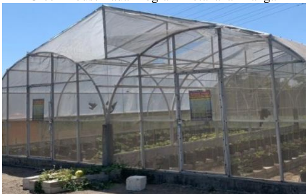
Gambar 1.2 Green House Pada Program Ketahanan Pangan