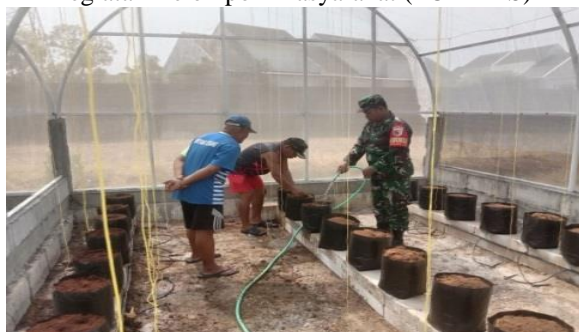
Gambar 1.4 Kegiatan Kelompok Masyarakat (POKMAS)