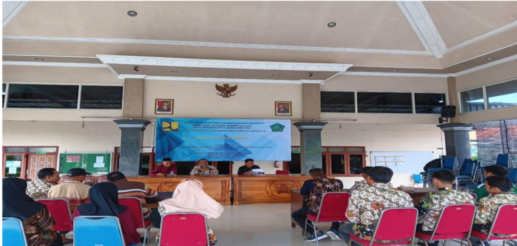
Gambar 2 Kantor Desa Kajeksan

Berdasarkan pada tabel 3 menjelaskan mengenai sarana dan prasarana yang ada di Pemerintah Desa Kajeksan Kecamatan Tulangan Kabupaten Sidoarjo. Perangkat yang digunakan oleh operator plavon yaitu laptop sehingga masyarakat yang kesulitan mengakses plavon dapat meminta bantuan pada operator plavon untuk mengurus keperluan adminduk. Printer digunakan untuk masyarakat sehingga masyarakat tidak perlu bingung ketika cetak mandiri karena sudah disediakan oleh Pemerintah Desa Kajeksan.