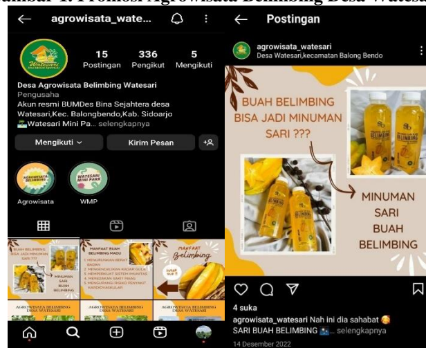
Gambar 1. Promosi Agrowisata Belimbing Desa Watesari