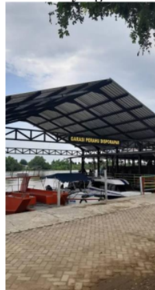
Gambar 3. Fasilitas yang diberikan Dispora

Tabel 2 menunjukkan bahwa terdapat beberapa fasilitas yang tersedia di Wisata Bahari Tlocor, termasuk area parkir, toilet, kantor, ruko, ticketing, perahu, spot selfie. Fasilitas tersebut penting untuk memenuhi kebutuhan pengunjung, sehingga mereka dapat merasa nyaman selama berada di wisata tersebut. Selain itu, Pemerintah Desa Kedungpandan juga mendapatkan bantuan dari Dinas Kepemudaan dan Olahraga (Dispora) Kabupaten Sidoarjo.