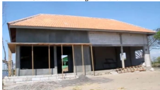
Gambar 2. Pembangunan Ruko PKL

“pemerintah desa mendirikan bangunan ruko untuk PKL, memperbaiki akses menuju objek wisata dengan menggunakan anggaran APBDes yang dikelola oleh Bumdes. Kami berharap, kedepannya pemerintah desa dapat menambahkan fasilitas yang dapat menarik minat Masyarakat”. (wawancara dengan Bapak Arifin selaku kasi pemerintahan bidang transportasi, Jumat 13 Oktober 2023).