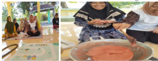
Gambar 4. Pelatihan Pembuatan Buah Tangan