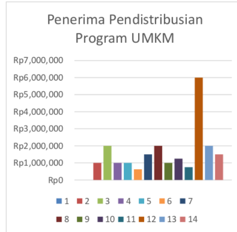
Gambar 3. Diagram Penerima Program Pemberdayaan UMKM th 2022

UMKM ini, sangat membantu para mustahik untuk dapat memenuhi kebutuhan hidupnya.