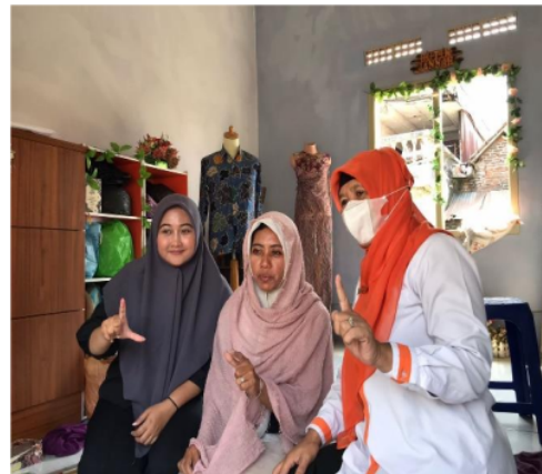
Gambar 4. Penerima Program Pemberdayaan UMKM th 2022

Diagram diatas adalah jumlah mustahik yang menerima bantuan pendistribusian dana ZIS melalui program Pemberdayaan UMKM. Terdiri dari 14 mustahik dengan menerima jumlah bantuan yang berbeda beda.