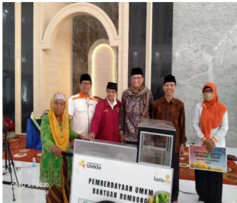
Gambar 5. Penerima Program Pemberdayaan UMKM th 2022

membutuhkan dana untuk membayar kontrakan yang ditempati untuk usaha jahid tersebut, karena pada saat itu beliau juga sedang sakit dan bertepatan jatuh tempo bayar kontrakan, sehingga beliau tidak mampu membayar dan akhirnya beliau mengajukan proposal bantuan pemberdayaan UMKM di Lazismu Sidoarjo dalam bentuk bantuan modal usaha. Setelah mendapatkan bantuan beliau mempunyai keinginan untuk menjadi muzakki di Lazismu Sidoarjo.