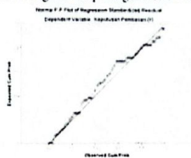
Gambar 1. Normal Probability Plot

Setelah diketahui hasil pengujian tersebut, telah didapat nilai dari uji Kolmogorov Smirnov sebesar 1,147 bahwa nilai tersebut lebih besar dari pada 0,05 ( >0,05 ), jadi bisa ditarik kesimpulan data tersebut berdistribusi normal. Agar lebih diketahui normal atau tidaknya menggunakan Plot of Regression Standardized Residual. Data dapat dinyatakan berdistribusi normal apabila sebaran data membentuk titik-titik yang mendekati garis diagonal sebagaimana pada gambar di bawah ini :