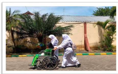
Gambar 2. Peserta didik menolong teman sebayanya yang sakit