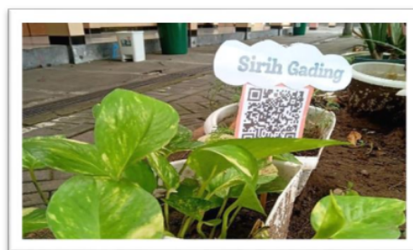
Gambar 3. Tanaman yang diberi kode QR

Aspek keempat yaitu akhlaq terhadap hewan, pada saat kegiatan profil pelajar pancasila peserta didik didorong dan disadarkan oleh guru Pendidikan agama islam agar memahami akan urgensinya mencintai dan memperlakukan hewan sebagai makhluk ciptaan Allah untuk memenuhi setiap haknya. Seperti contoh memberi makanan dan minuman kepada hewan, tidak memukul atau mengurung hewan dan memberikan tempat tinggal yang nyaman dan layak. Dari penyadaran dan dorongan tersebut guru Pendidikan agama islam juga mengadakan proyek kegiatan profil pelajar pancasila dengan menayangkan hal-hal yang berkaitan dengan kegiatan pecinta hewan dari internet. Kemudian juga dapat mendatangkan seseorang animal lovers ke sekolah atau melakukan kunjungan ke animal shelter agar bisa mempraktekkan secara langsung untuk menolong dan memberi kasih sayang terhadap hewan.