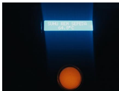
Gambar 5. Hasil nyala lampu led sesuai set point suhu pada sistem

Tabel 2 menjelaskan tentang hasil pembacaan Pada pengujian seluruh sistem dapat diketahui bahwasannya sistem pengaman rem pada sepeda motor matic dapat bekerja dengan baik dan lancar sesuai dengan program arduino yang telah dibuat. Bisa dilihat bahwa pada saat temperature sistem pengereman mencapai batas yang telah ditentukan dalam masing – masing set point suhu maka masing – masing komponen bekerja dengan baik sesuai yang diinginkan. Dan apabila suhu telah mencapai batas tidak aman atau bahaya pompa air mini akan menyala bebarengan dengan bunyi buzzer hingga batas suhu kembali sedang atau aman.