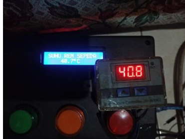
Gambar 4. Hasil pengujian sensor

Pada pengujian ini dilakukan dengan cara 6 kali pengukuran pada sistem pengereman sepeda motor matic kemudian dibandingkan dengan hasil yang didapat oleh thermometer digital yang sudah ada. Berdasarkan tabel 1 diatas, didapatkan persentase ketepatan antara alat yang dibuat dengan thermometer digital yang sudah ada rata rata mencapai 99,86% dan error hanya mencapai 0,09%. Hal ini menunjukkan alat ini sudah berfungsi dengan baik untuk mendeteksi suhu pada sistem pengereman sepeda motor matic.