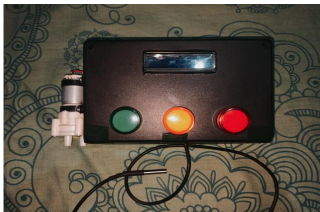
Gambar 2. Bentuk alat