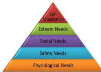
Gambar 2: Teori Piramida Hirarki Abraham Maslow

Salah satu penyebab yang memicu pada maju mundurnya budaya literasi ialah keberadaan sumber daya manusia. Manusia dapat mengefektifkan budaya literasi, dan merancang semua pendukung literasi, untuk menghasilkan produk tulisan yang berkualitas karena sumber daya manusia merupakan kunci penggerak roda budaya literasi agar dapat berjalan dinamis (Muhibbin and Marfuatun 2020). Abraham Maslow juga menambahkan pendapat lain, bahwa dalam mencapai sebuah tingkat kebutuhan berikutnya, seseorang bisa menggunakan pada kekuatan motivasi untuk mendorongnya mencapai pada tingkat berikutnya. Landasan yang digunakan individu dalam memenuhi kebutuhannya, yaitu pertumbuhan kekurangan sebagai kekurangan dan motivasi pertumbuhan sebagai motivasi perkembangan. Artinya pertumbuhan defisiensi merupakan upaya yang dilakukan individu untuk memenuhi kekurangannya. Kemudian motivasi tumbuh didefinisikan sebagai motivasi yang nampak secara alami dari dalam diri perorangan dan bermanfaat baginya lebih bersemangat dalam mencapai keinginan dan tujuannya (Maslow 1943).