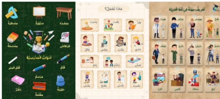
Gambar 1. Media Poster

Gambar diatas merupakan desain asli media poster yang peneliti gunakan 2 dalam pembelajaran mufrodad di dalam kelas 5 SD Muhammadiyah 1 Sedati. Meskipun media poster dapat menawarkan pembelajaran yang menarik dan mudah dipahami siswa, namun hasil 2 observasi menunjukkan bahwa dalam pembelajaran mufrodad bahasa arab di lingkungan sekolah masih jarang 2 menggunakannya untuk menyampaikan pelajaran. Selain itu, agar siswa dapat 2 memahami materi dan dapat mengartikulasikan pemahaman mereka, media poster menuntut mereka agar dapat menganalisis secara kritis gambar dan informasi yang ada pada media poster tersebut.