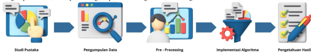
Gambar 1. Proses Kerja Penelitian

Penelitian ini terdiri dari 5 proses kerja penelitian sebagaimana ditunjukkan pada gambar 1, yakni : Studi pustaka, Pengumpulan data, Pre – processing, Implementasi algoritma, dan Pengetahuan hasil.