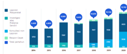
Gambar 1. Jumlah Pengaduan Masyarakat Atas Kinerja Pelayanan Publik

Pelayanan publik di Indonesia dalam penyelenggaraannya masih ditemukan berbagai masalah seperti penundaan yang berlarut, maladministratif, adanya perilaku diskriminatif dari petugas pemberi layanan, pelayanan yang berbelit-belit, prosedur yang tidak sesuai, konflik kepentingan, dan penyalahgunaan wewenang yang membuat masyarakat merasakan kekecewaan terhadap penyelenggara pelayanan publik yang pada akhirnya membuat mereka melaporkan masalah ini kepada Ombudsman selaku badan pengawas penyelenggara pelayanan publik [2]. Untuk lebih memahami data laporan/pengaduan masyarakat yang terregister pada aplikasi SIMPeL dan ditindaklanjuti, sebagai berikut: